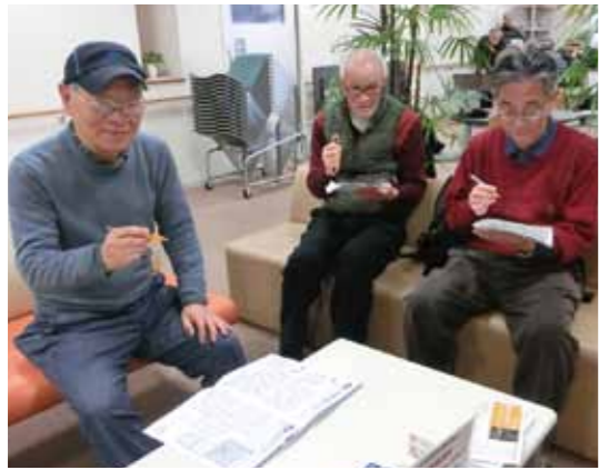
ナンプレ仲間集合

平成 30 年 (2018 年) 3 月発行 〒565-0862 吹田市津雲台 1-2-1 千里ニュータウンプラザ 5 階 電話 : 06-6155-2155 FAX : 06-6155-2177 ホームページ http://suita-ikigai.org/