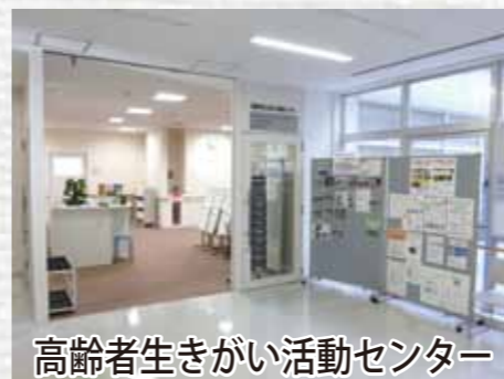
高齢者生きがい活動センター